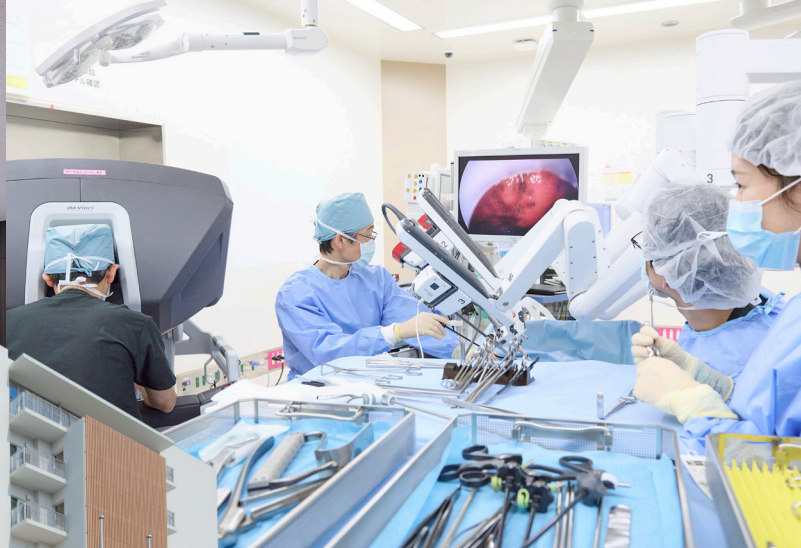
手術支援ロボット(ダビンチ)